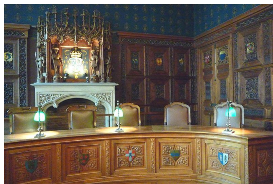
La salle du Parlement

La visite étant limitée à 18 personnes ne tardez pas à vous inscrire