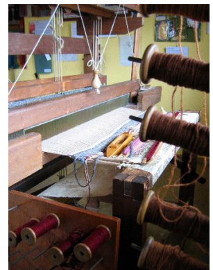
Métier à tisser à bras