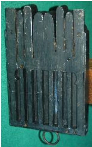
Main de fer

Emblème de la vie quotidienne régionale au XIX ème siècle