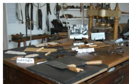
Table de coupe