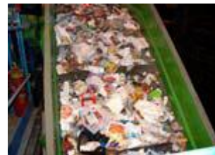
Convoyeur à bande

La Dauphinoise de Tri traite aujourd'hui les déchets produits par les habitants des 26 communes de l'agglomération grenobloise mais également ceux produits par certaines collectivités extérieures à l'agglomération. La quantité de déchets augmente en moyenne de 3 % par an.