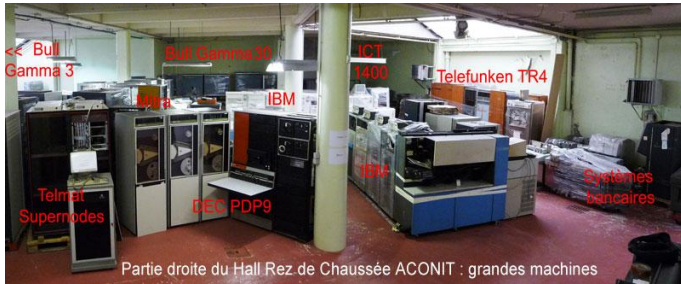
Main de fer